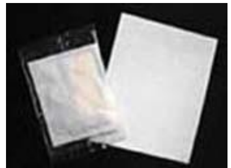
Patch Chi-Sana avec bande adhésive pour une utilisation ciblée

Jour après jour, l'organisme humain absorbe des substances toxiques qui sont alors éliminées au maximum par le métabolisme. Les toxines et les déchets restant dans le corps ont un impact négatif sur notre bien-être et sur notre performance; ils conduisent tôt ou tard à des problèmes de santé. En raison de la pollution croissante, il est également de la plus grande importance de dépurifier notre corps de façon efficace et durable.